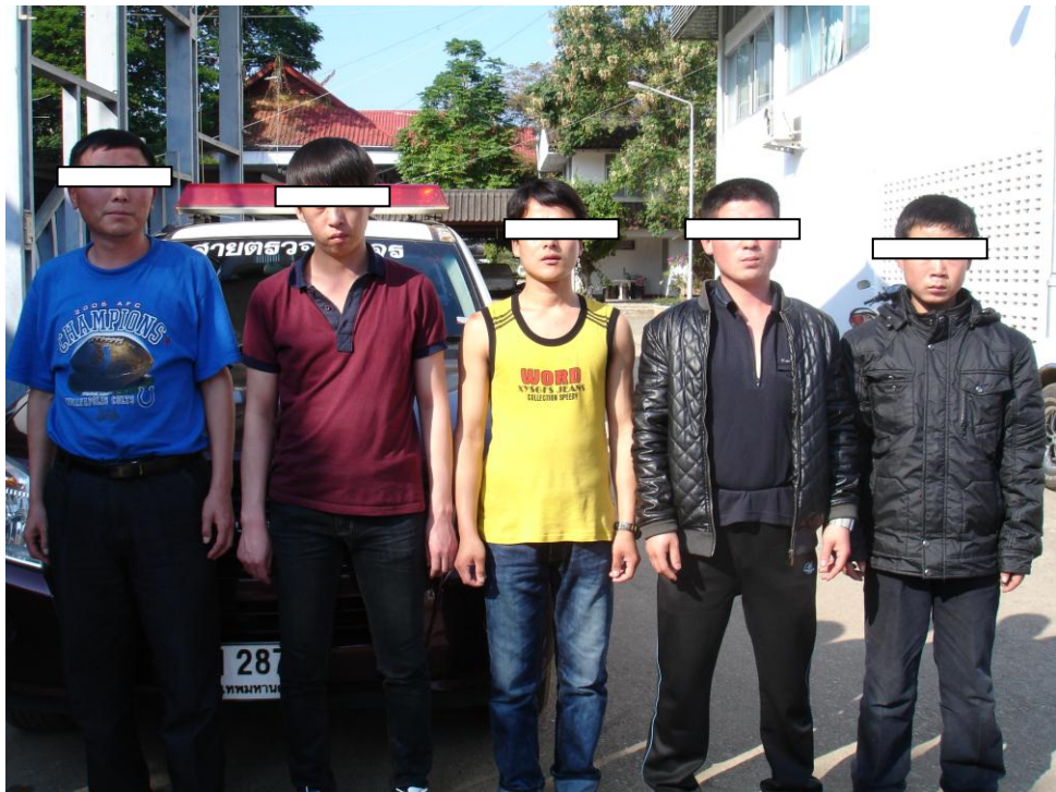
ภาพผู้อพยพหลบหนีเข้าเมืองชาวเกาหลีเหนือ ในเขตพื้นที่อำเภอเชียงแสน จังหวัดเชียงราย