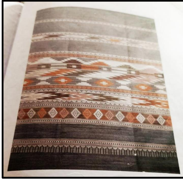
ลายข้ามหลามตัดผสมลายน้ำไหล